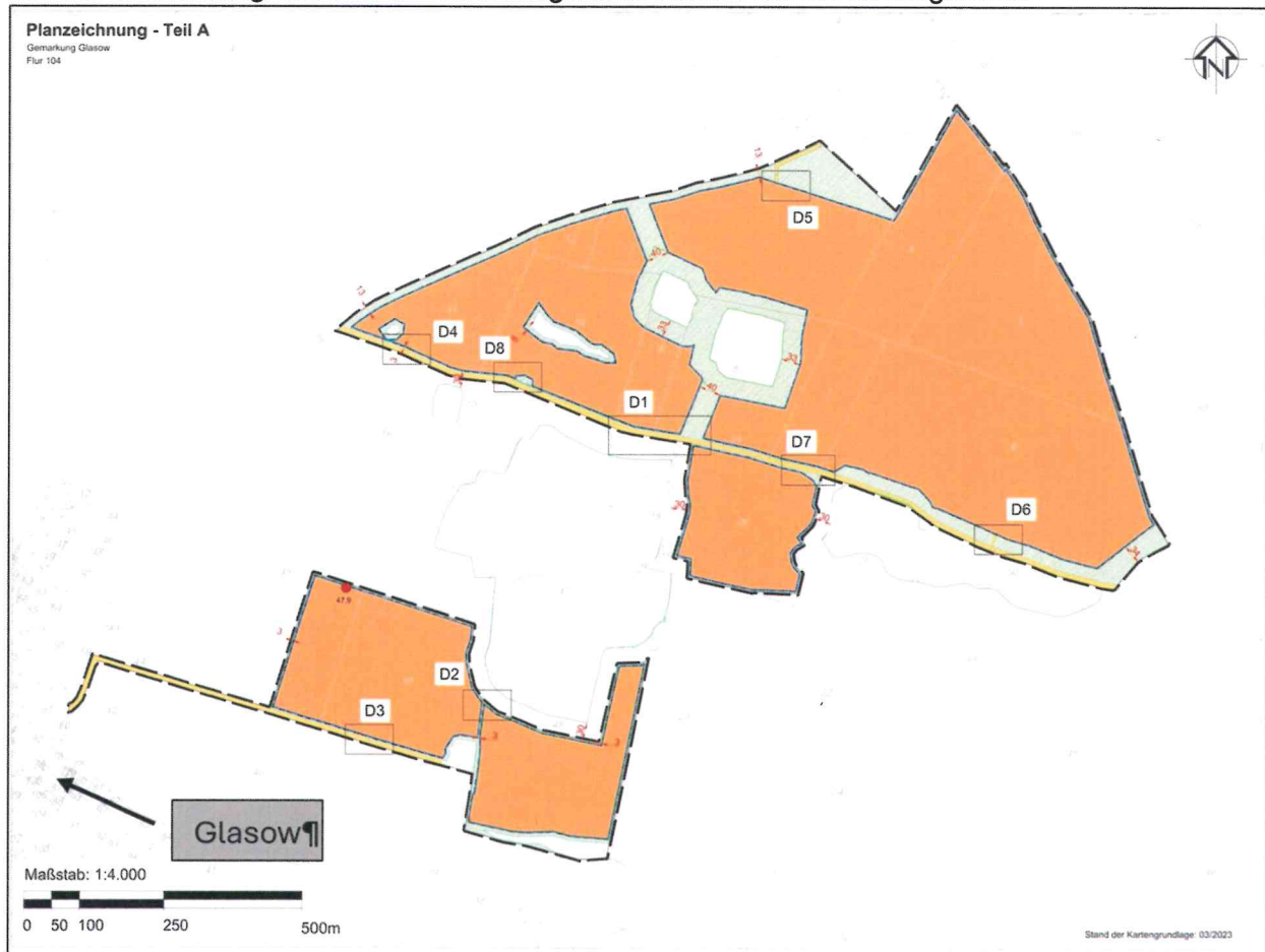
Abbildung 1: Vorhabengebiet - vorhabenbezogener Bebauungsplan Nr.1 "Solarpark Randow-Plateau" der Gemeinde Glasow

Der Geltungsbereich des vorhabenbezogenen Bebauungsplans Nr. 1 „Solarpark Randow-Plateau“ der Gemeinde Glasow umfasst eine Fläche von ca. 82,5 ha auf den Flurstücken 44, 45 (tlw), 46 (tlw), 48 (tlw), 6, 7, 8, 9, 10, 11, 12, 13, 14, 3, 5 und 20 (tlw) der Flur 104 in der Gemarkung Glasow und ist im folgenden Kartenausschnitt dargestellt: