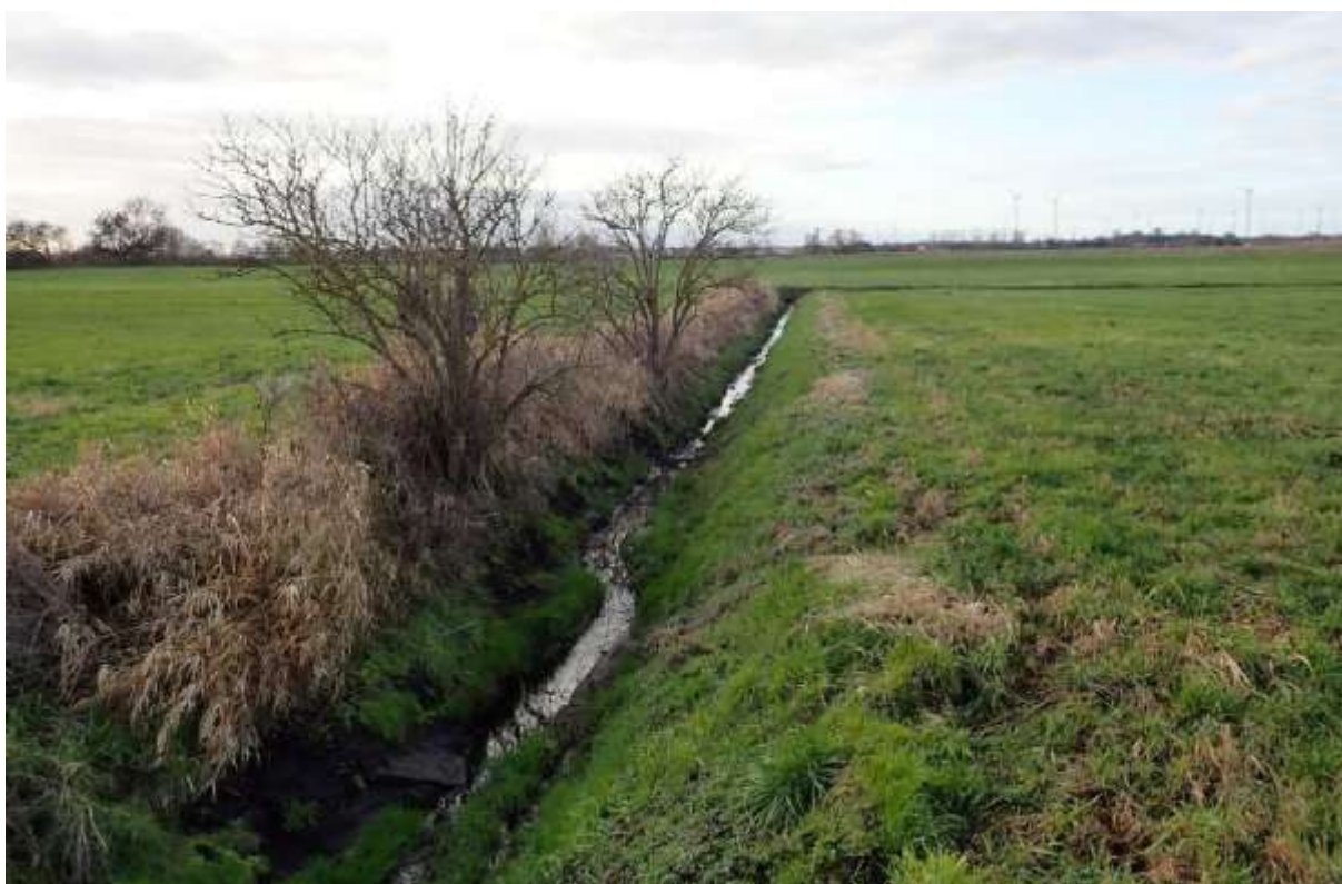
Bild 02 Graben mit Holunder und Schilf vom Osten - kein Eingriff