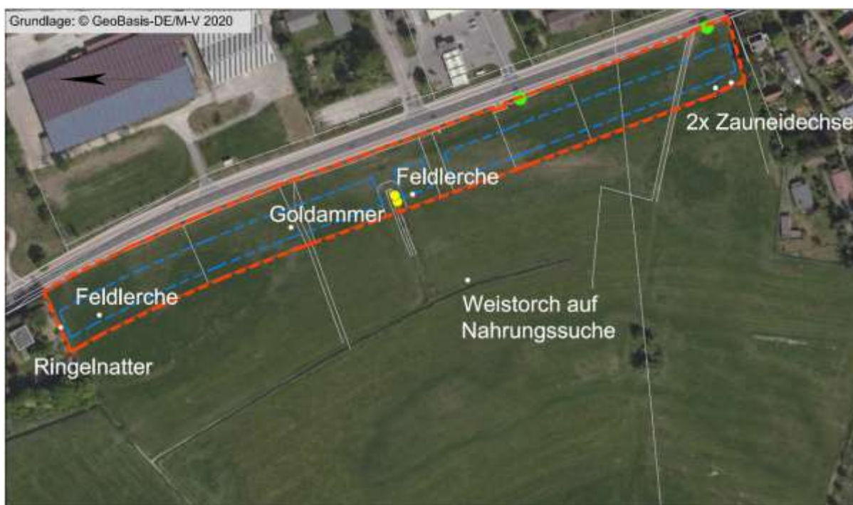
Abbildung 2: Lage des Vorhabens

Die Zauneidechsen wurden am westlichen Rand des Plangebietes außerhalb der Baugrenze festgestellt. Da die Bauarbeiten vom Osten her erfolgen und sich nur bis zur Baugrenze ausdehnen, ist kein Konflikt mit der Art zu erwarten. Eine weitere Prüfung erfolgt nicht