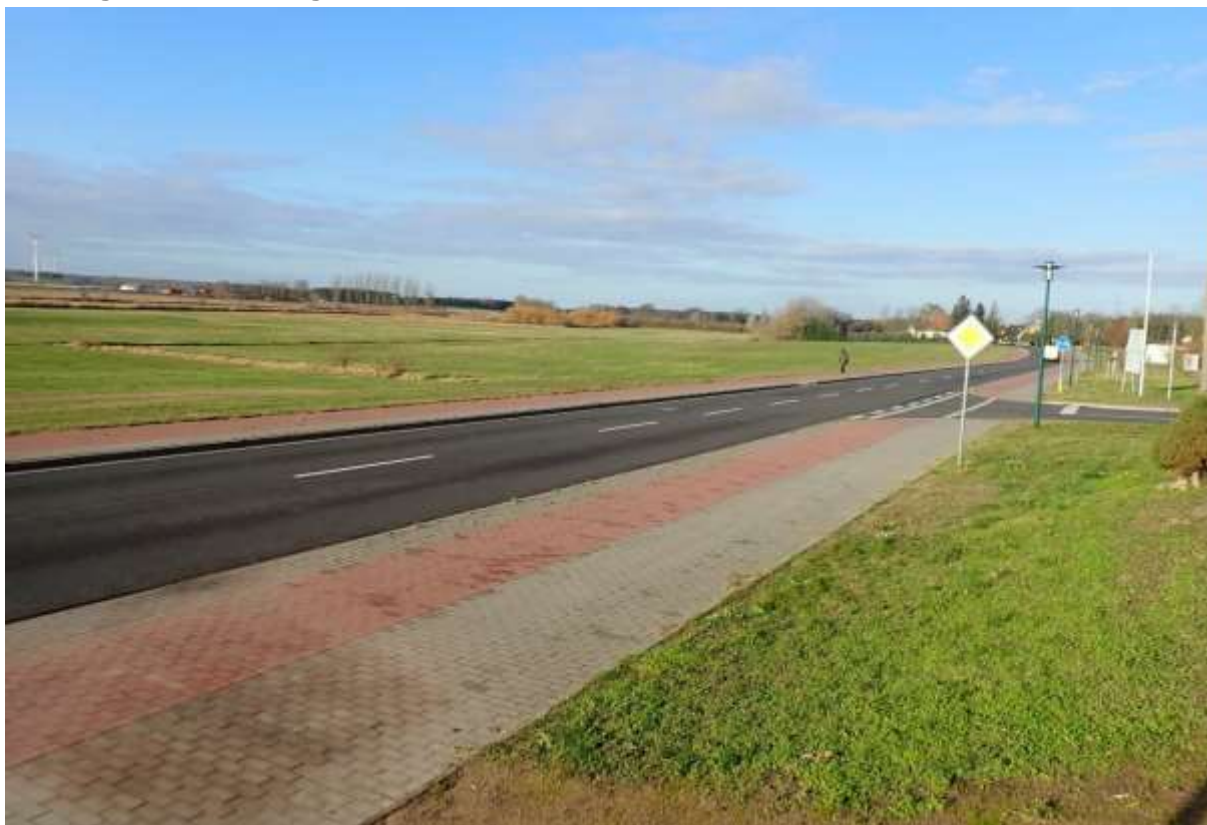
Bild 01 Plangebiet vom Osten